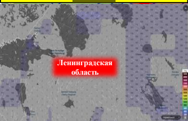
ПРОГНОЗ ВЫПАДЕНИЯ ОСАДКОВ 27.08.2020